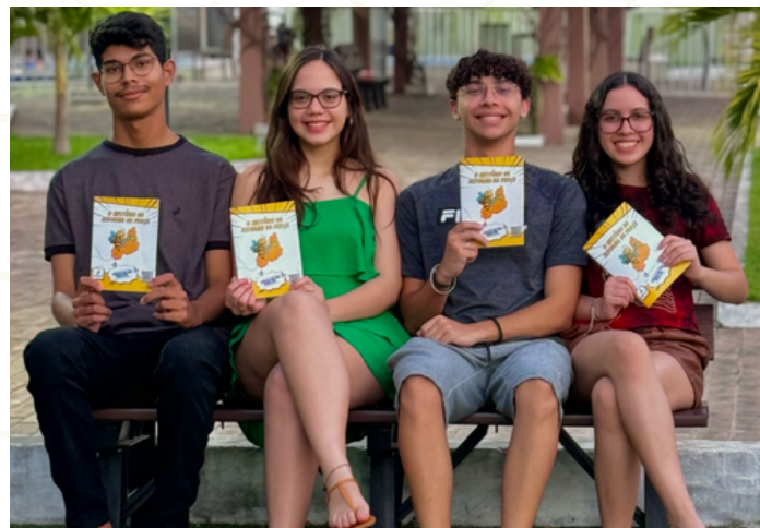
Jovens responsáveis pela criação da revista em quadrinhos